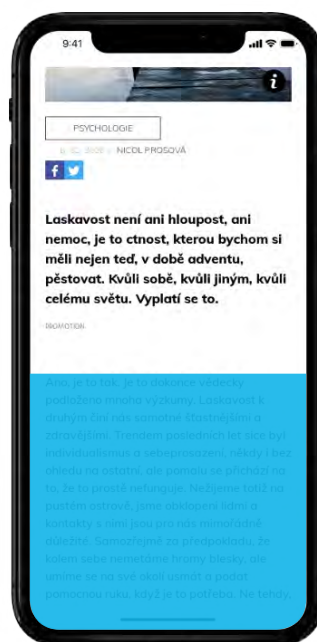
INTERSCROLLER MOBILE RECTANGLE