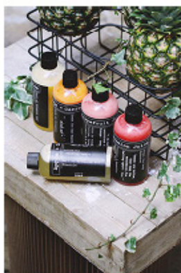
ořez na výšku 270 x 405 px