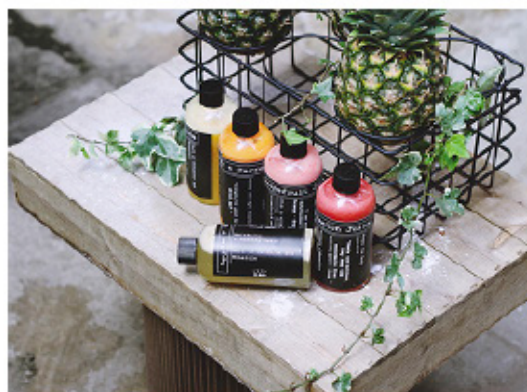
ořez na šířku 630 x 460 px