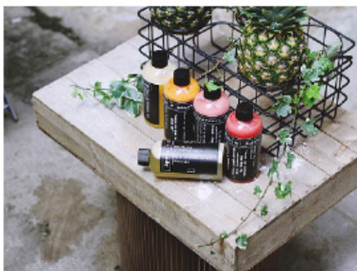
původní obrázek 1280 x 900 px